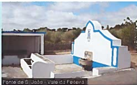
Fonte de S. João - Vale da Feiteira