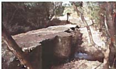
Ponte do Vale das Colmeias - Monte do Braçal