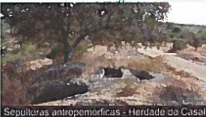
Sepulcros antropomórficos - Herdade do Casal