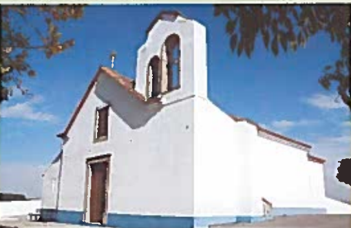
Santuário da N. Sr.ª das Necessidades - Vale de Grou