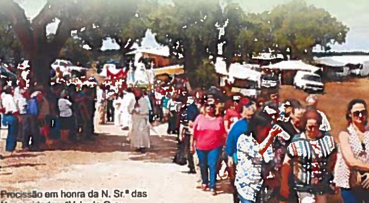
Procissão em honra da N. Sr.ª das Necessidades - Vale do Grou