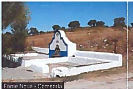
Fonte Nova - Comenda